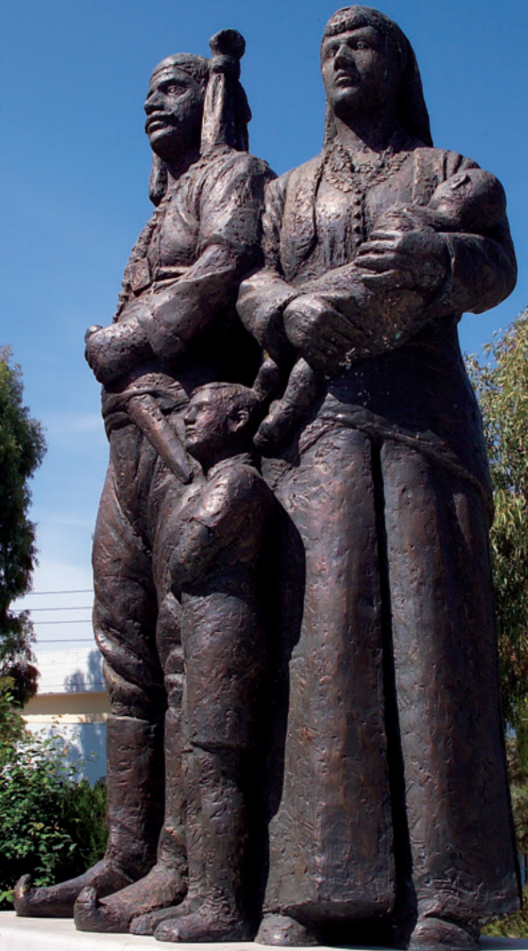
Μνημείο Ποντιακού Ελληνισμού Κεντρική Πλατεία Σουρμένων

Ένωση Ποντίων Σουρμένων Έτος Ιδρύσεως 1924